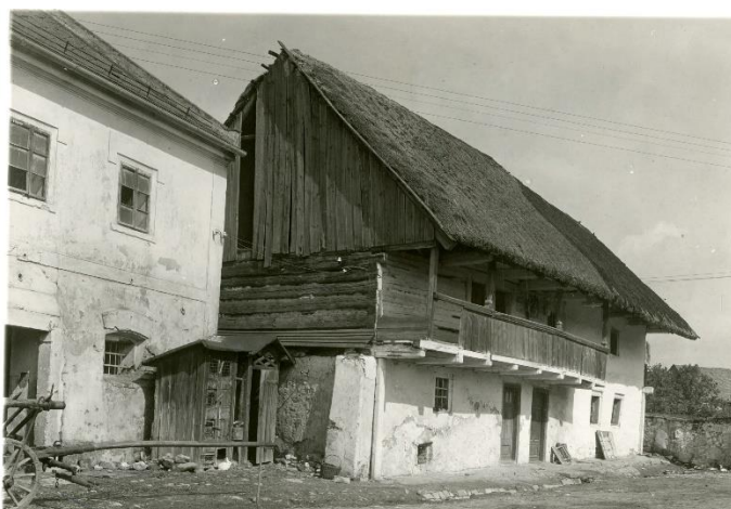
Bukovno, čp. 6 – roubený dům s pavlačí