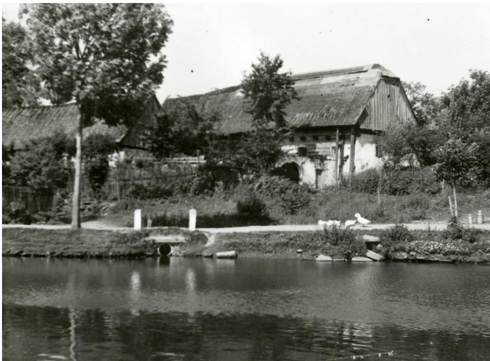
Zbožice na Havlíčkovodsku

Fotogalerie, ZDROJ: Etnologický ústav AV ČR: