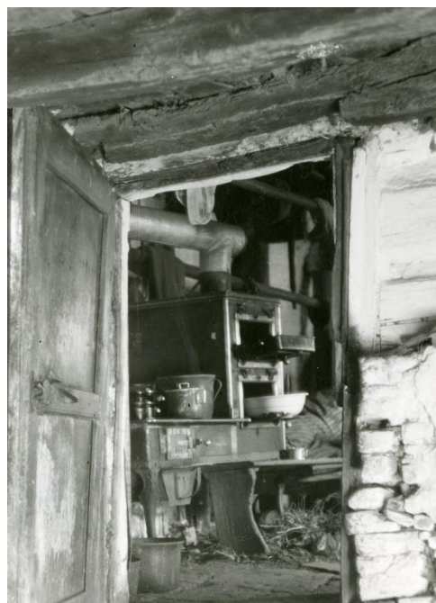
Zbožice, pohled ze dvora (vlevo) a interiér na dobových fotografiích