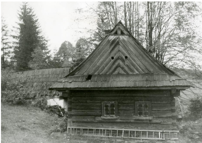
Ostravice na Frýdecko-Míšecku, dům karpatského typu