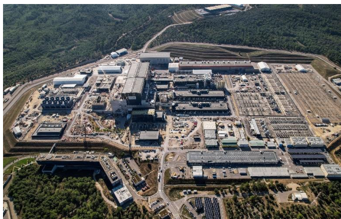
Pohled na areál projektu ITER.